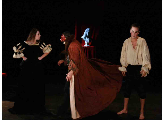
Scapin, Le Malade Imaginaire et La Mort de Molière