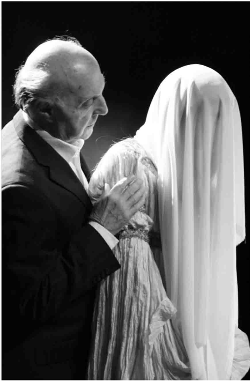
L'École des Femmes