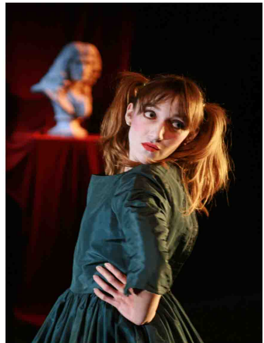
Les Femmes Savantes